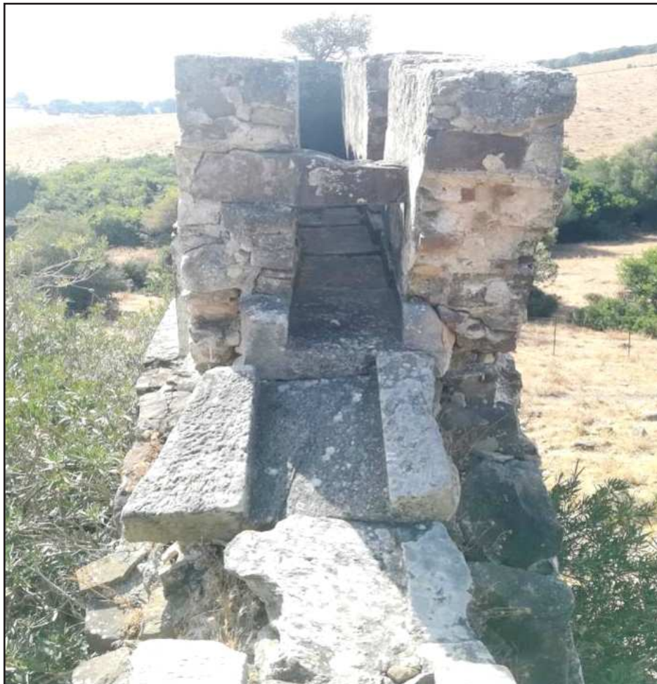
Ilustración 5.- Sección de atarjea. Molino del arroyo de la Canaleja.