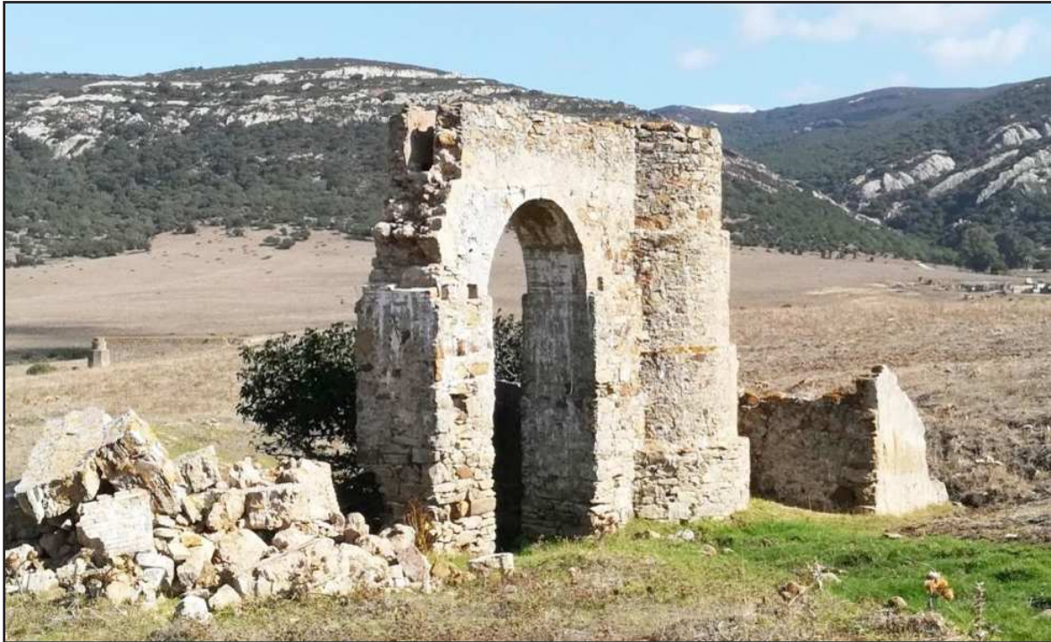
Ilustración 4.- Molinos del cortijo de la Haba. El primer molino, atarjea con arco, cubo, sala de molienda. Segundo molino a la izquierda de la imagen, cubo y atarjea. En el fondo el Aciscar.