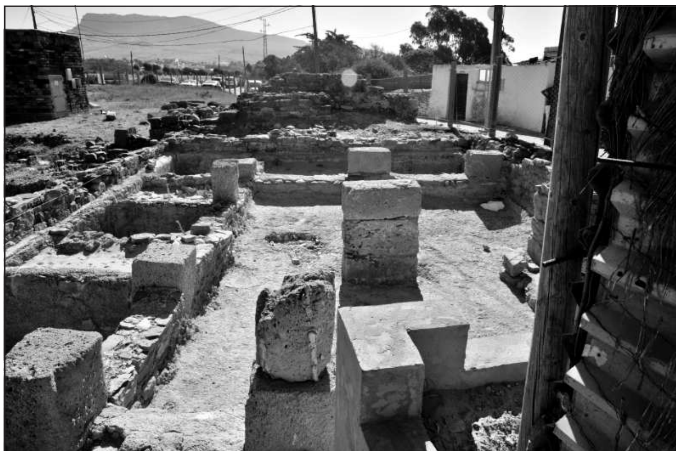
Ilustración 7.- Proyecto General de Investigación UCA.