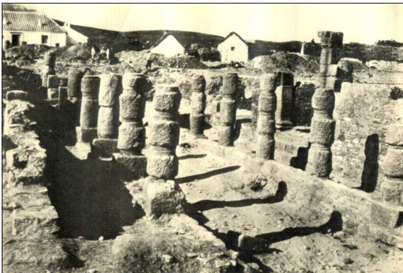
Ilustración 1.- Cardo de las columnas durante las excavaciones de P. Paris.

Desde finales de septiembre de 2017 el Conjunto Arqueológico de Baelo Claudia tiene vacante la plaza de director, sin que hasta la fecha de publicación de este artículo se haya cubierto. La mayoría de los programas de conservación y mantenimiento puestos en marcha por la anterior dirección, después de un análisis exhaustivo de las patologías existentes, han sido paralizados y los equipos de investigación están teniendo problemas para la utilización de las dependencias técnicas y administrativas del Conjunto Arqueológico. De no paliarse esta situación la ciudad hispanorromana de Baelo Claudia volverá al letargo de tiempos pasados y a la ralentización de las acciones de custodia y tutela global, que tanto costó poner en marcha, hace ahora una década, con el esfuerzo de todo el equipo humano del Conjunto Arqueológico, verdadero motor del despegue patrimonial al que hemos asistido durante esos años en esta pequeña ciudad hispanorromana de Baelo Claudia, hoy centro de referencia en la investigación científica a nivel internacional.