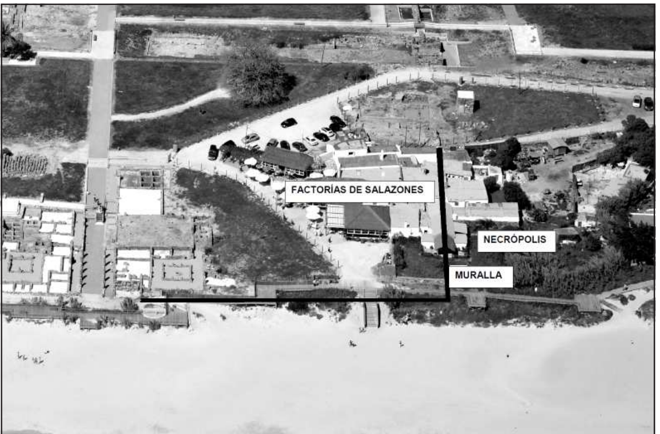
Ilustración 5.- Vista de las pervivencias del antiguo poblado de Bolonia.