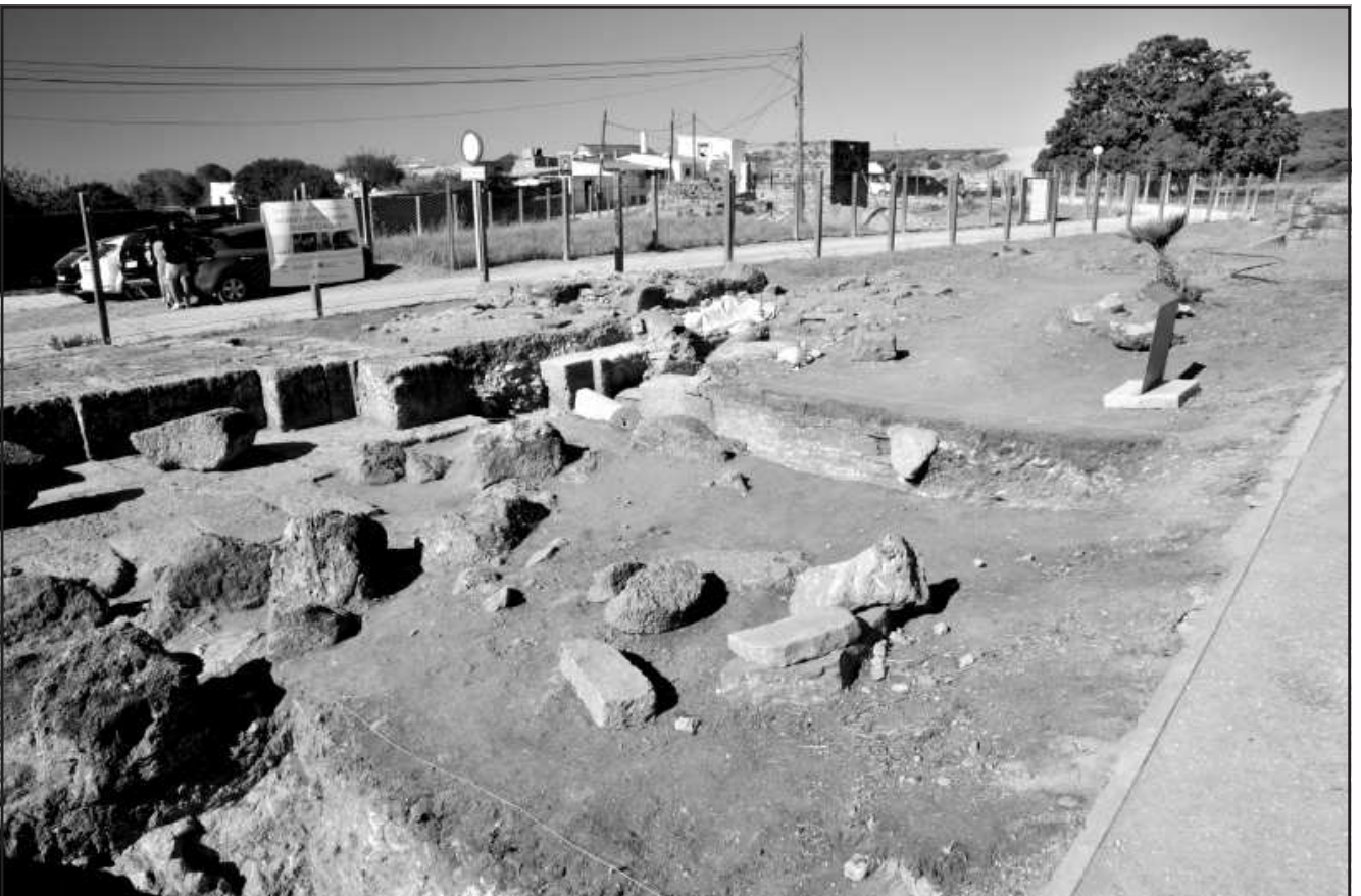
Ilustración 9.- Proyecto General de Investigaciones UA.