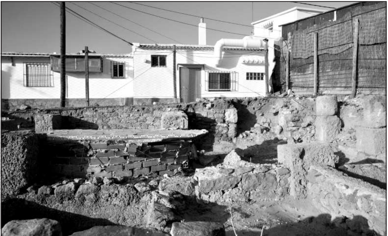
Ilustración 3.- Vista de la fosa séptica construida en la década de los ochenta.