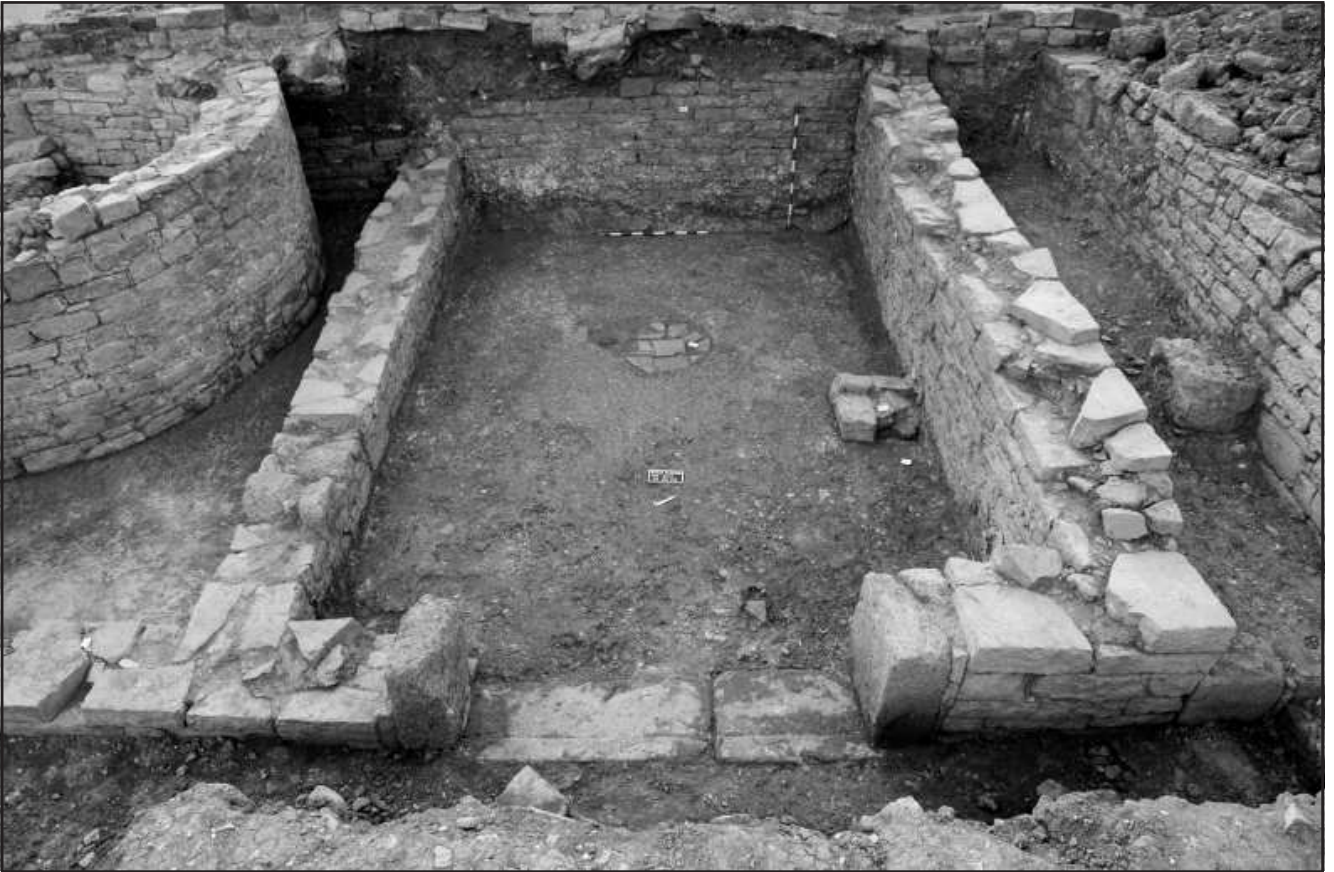
Ilustración 8.- Proyecto General de Investigación Universidad de Rochelle.