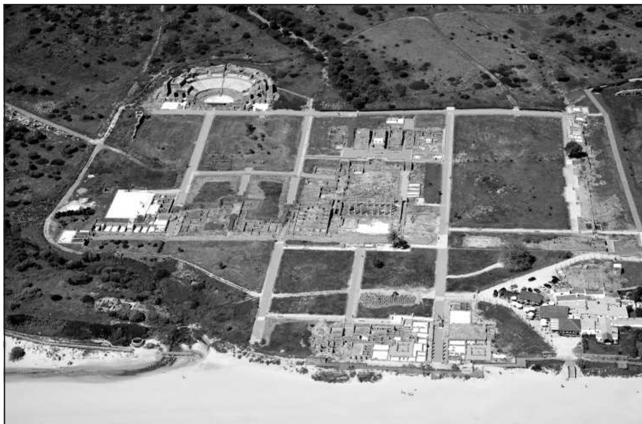
Ilustración 6.- Vista aérea de Baelo Claudia. Año 2014.