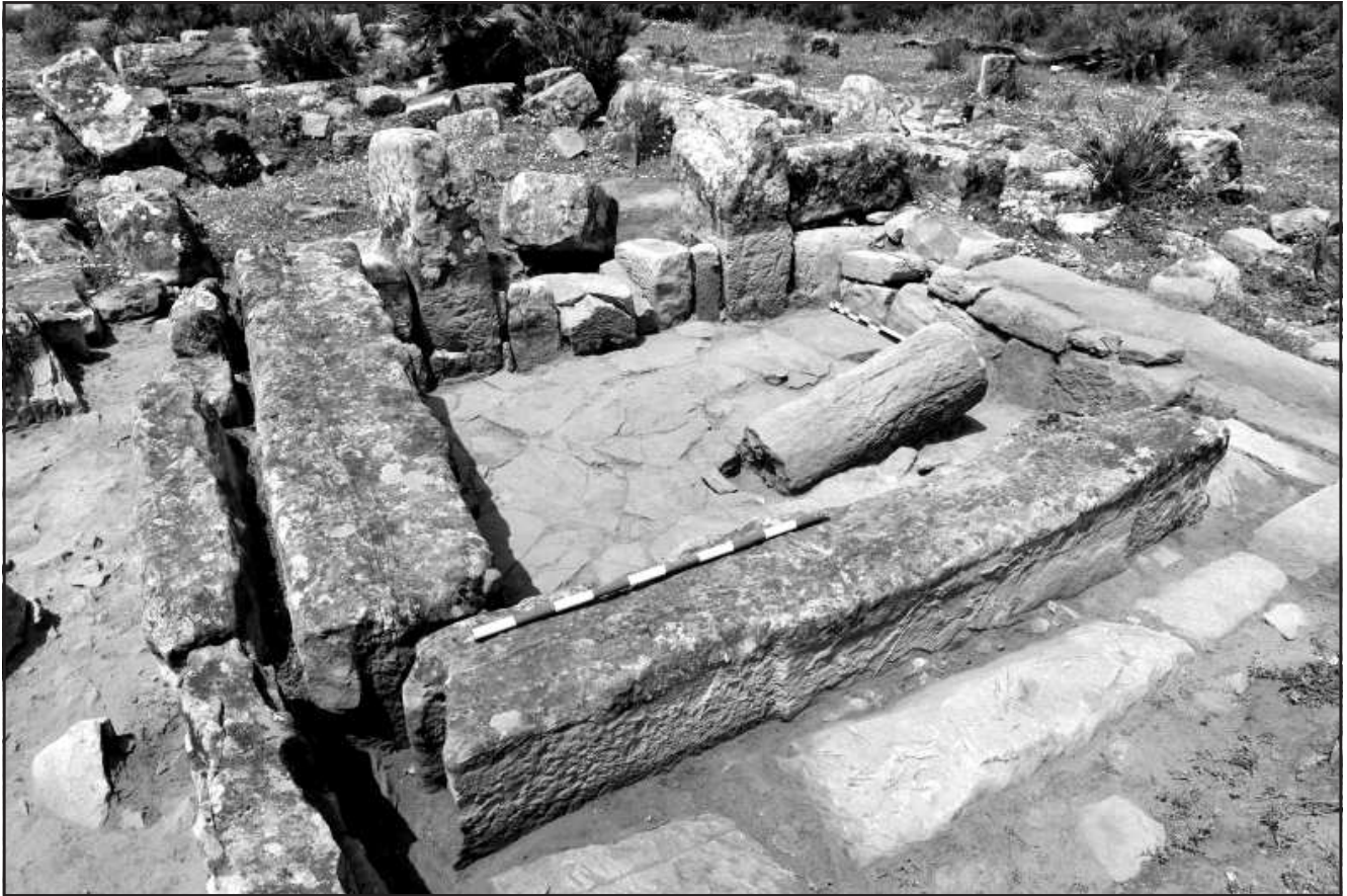
Ilustración 10.- Proyecto General de Investigaciones UT.