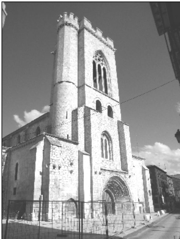
Imagen 8.- Iglesia de San Miguel en Palencia. En uno de sus altares se conmemoraba la victoria de Santa Clara en Tarifa.

a 22 de sus hombres a caballo y a 10 peones a coger ganado por los campos de Algeciras. Mala fortuna tuvieron, porque el adalid que los guiaba aunque cristiano, se encontraba confabulado con los moros de Algeciras. Llevó intencionada y sorpresivamente a la tropa cristiana cerca de la esta población, siendo por este motivo capturados todos los cristianos.