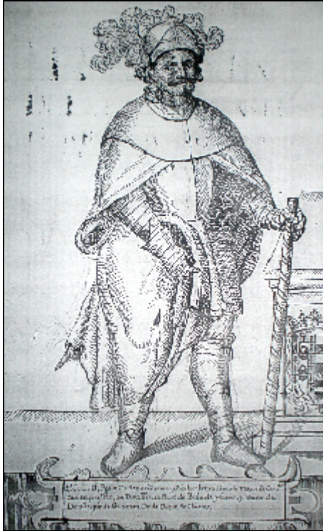
Imagen 3.- Pedro de Guzmán, adelantado mayor de Castilla y padre de Guzmán el Bueno. Dibujo del siglo XVI.

Guzmán tuvo amores con una leonesa de nombre Isabel de donde nació Guzmán el Bueno.