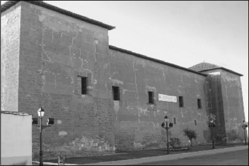
Imagen 2.- Palacio de Toral de Guzmán (León), que perteneció a la rama leonesa de los Guzmanes.

confirmantes da fe de la importancia de su estado.