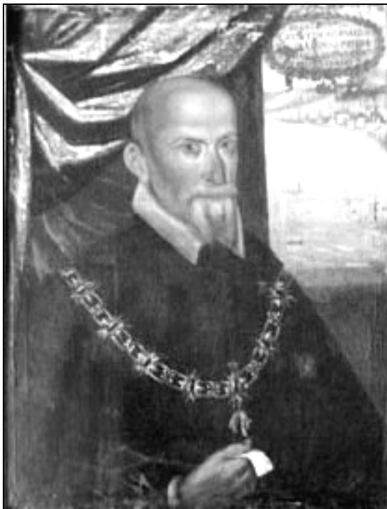
Imagen 5.- Retrato idealizado de Guzmán el Bueno.

hemos encontrado documento de la época que nos lo pueda demostrar, pero podría ser cierto, dada la vinculación de este Guzmán con el rey.