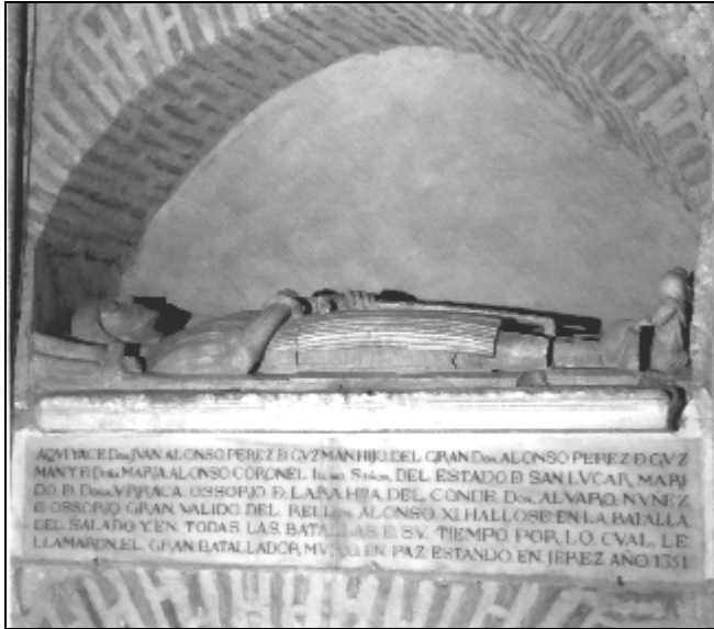
Imagen 7.- Enterramiento de Juan Alfonso Pérez de Guzmán, hijo de Guzmán el Bueno, en el monasterio de San Isidoro del Campo.

Luis de la Cerda; fuera del matrimonio tuvo a Teresa a quien crió María Coronel y que casó con Juan Ortega, hijo del almirante Juan Mate de Luna.