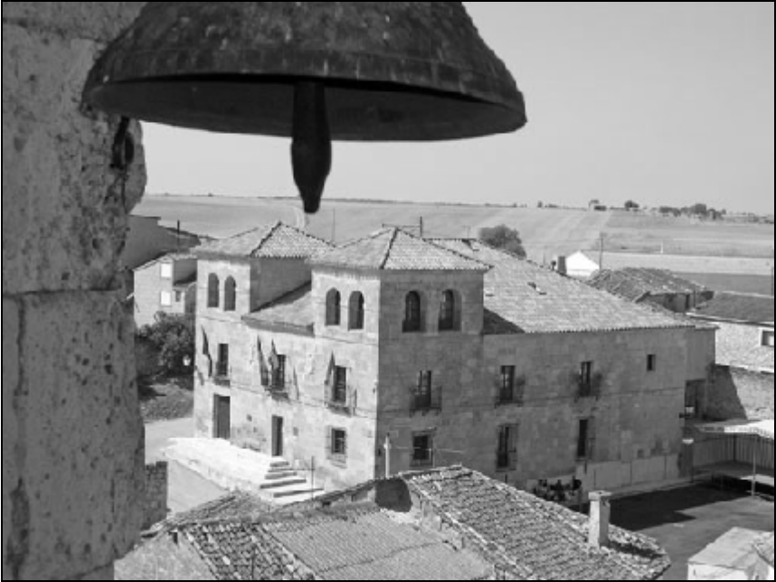
Imagen 1.- Palacio de los Guzmanes en la población de Guzmán (Burgos), donde estuvo el primer asiento de la casa de Guzmán.

de Castro, José Pellicer de Ossau, don Pedro conde de Bracelos, Ambrosio de Morales o Juan Alonso Martínez Calderón pusieron su interés en recuperar la genealogía de Alonso Pérez de Guzmán. 2 El