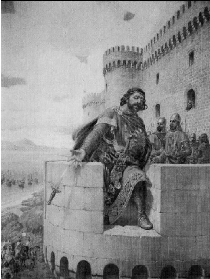
Imagen 4.- Guzmán el Bueno en el momento de arrojar el cuchillo desde el castillo de Tarifa. Obra del pintor leonés Primitivo Álvarez