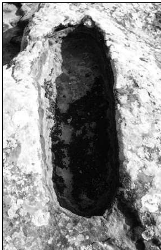
Ilustración 4.- Tumba con fosa de tipo bañera.