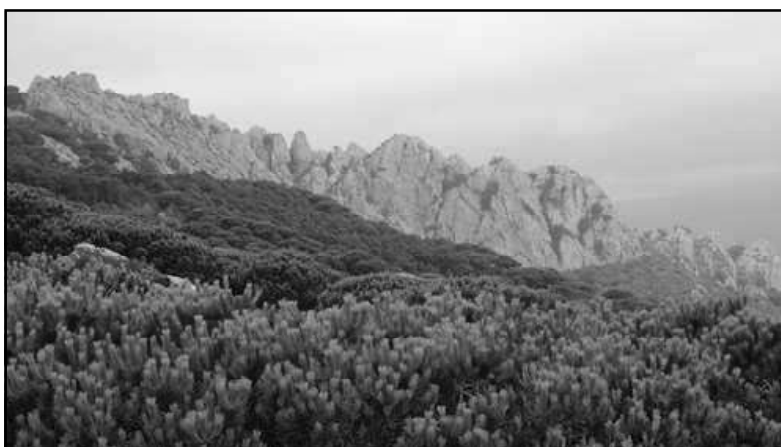
Ilustración 2.- Vista de la cresta de la Sierra de San Bartolomé (Tarifa, Cádiz).