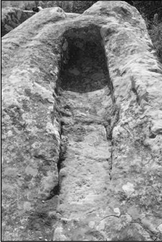
Ilustración 5.- Tumba de tipo rectangular.