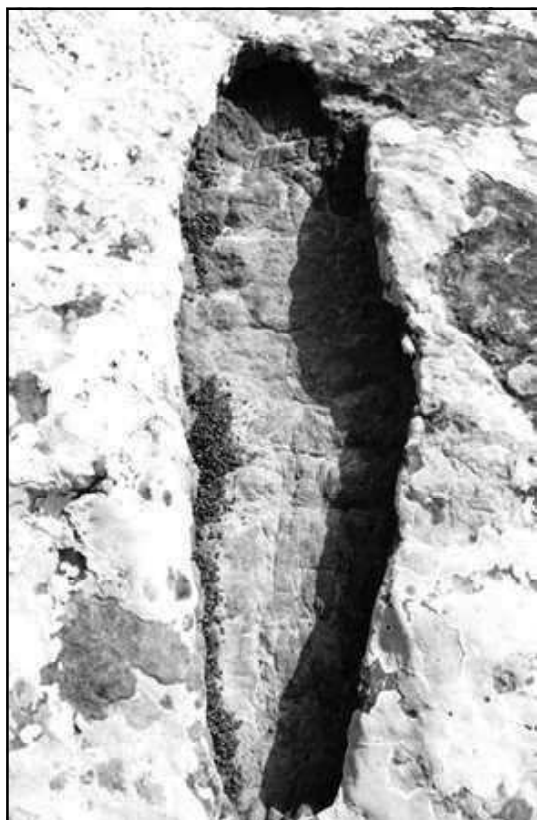
Ilustración 3.- Modelo de fosa antropomorfa.