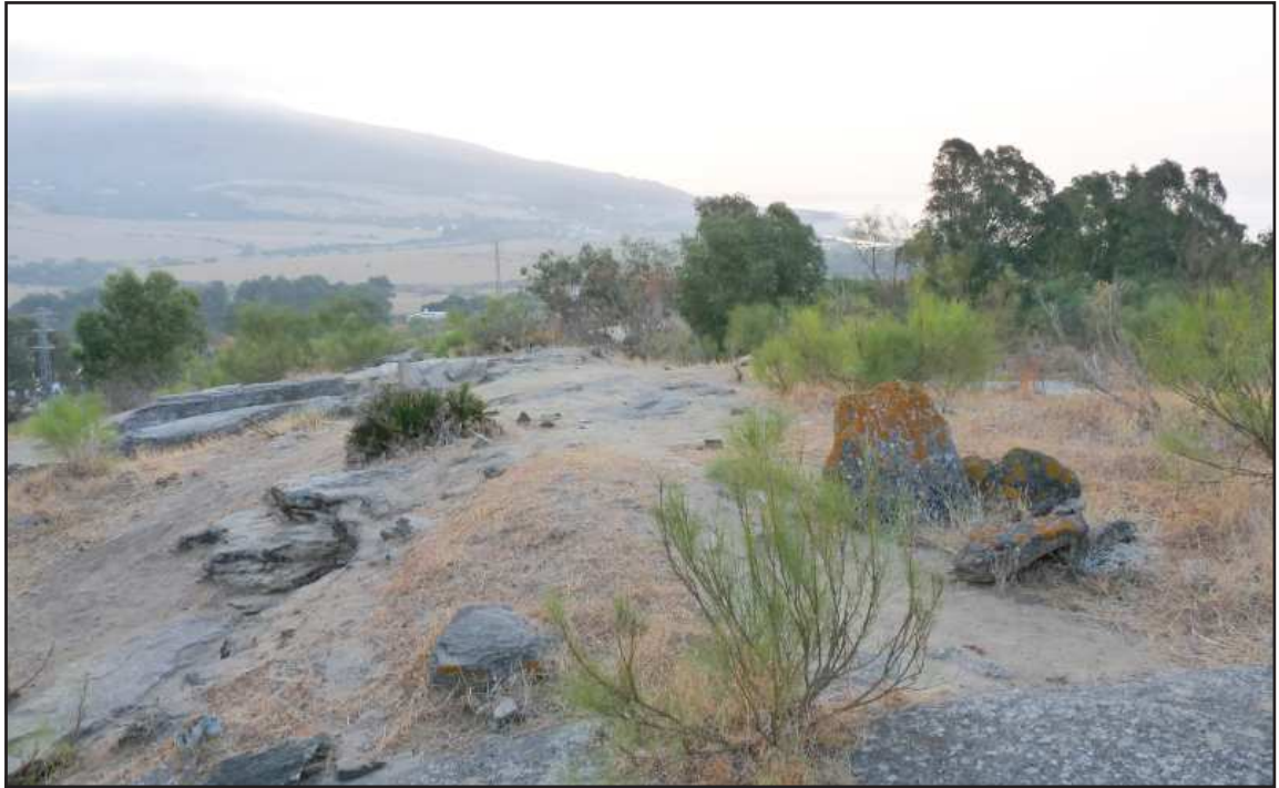
Ilustración 2.- Vista general de la necrópolis de Los Algarbes.