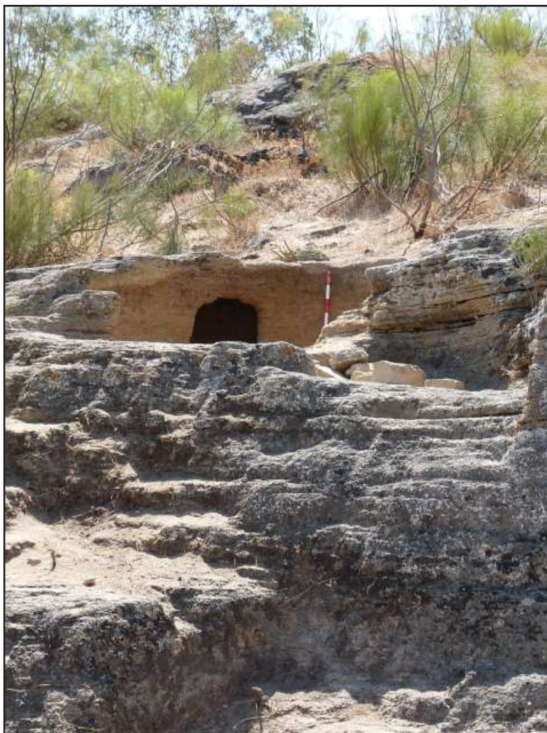
Ilustración 3.- Vista general de la Estructura 14.