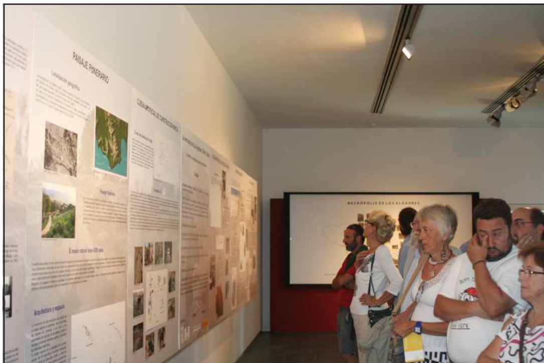
Ilustración 5.- Vista general de la exposición.