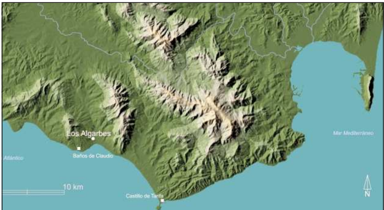
Ilustración 1.- Localización geográfica.

Este trabajo forma parte de los resultados del Proyecto de Investigación I+D+i denominado La necrópolis de Los Algarbes (Tarifa, Cádiz). La permanencia del paisaje funerario en el ámbito del Estrecho de Gibraltar (HAR2011-25200), autorizado y financiado por el Ministerio de Economía y Competitividad del Gobierno de España. Igualmente, queremos agradecer la revisión de la traducción al inglés realizada por Francisco Rubio Cuenca (Universidad de Cádiz).